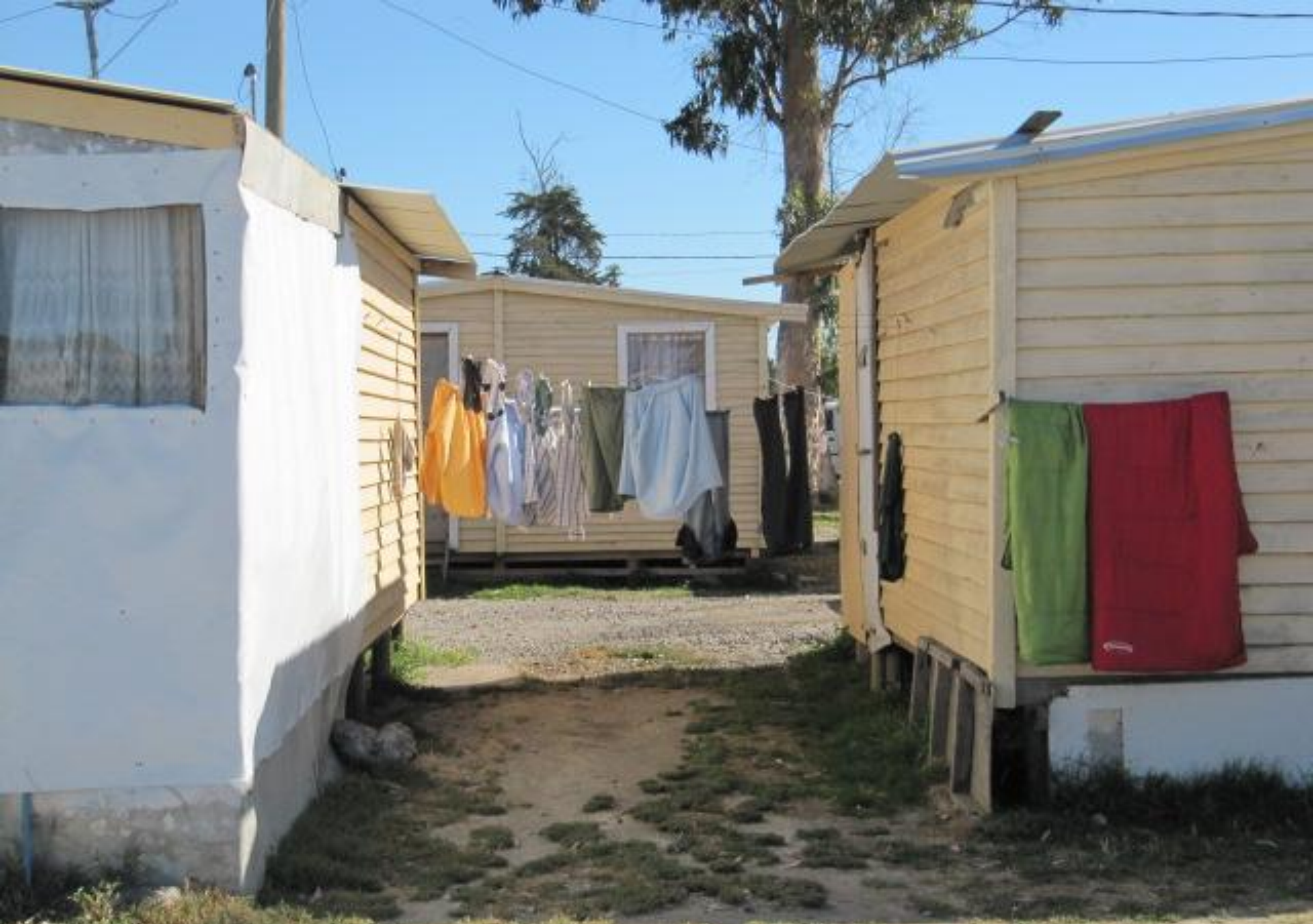
Campamento Santa Clara / Concepcion