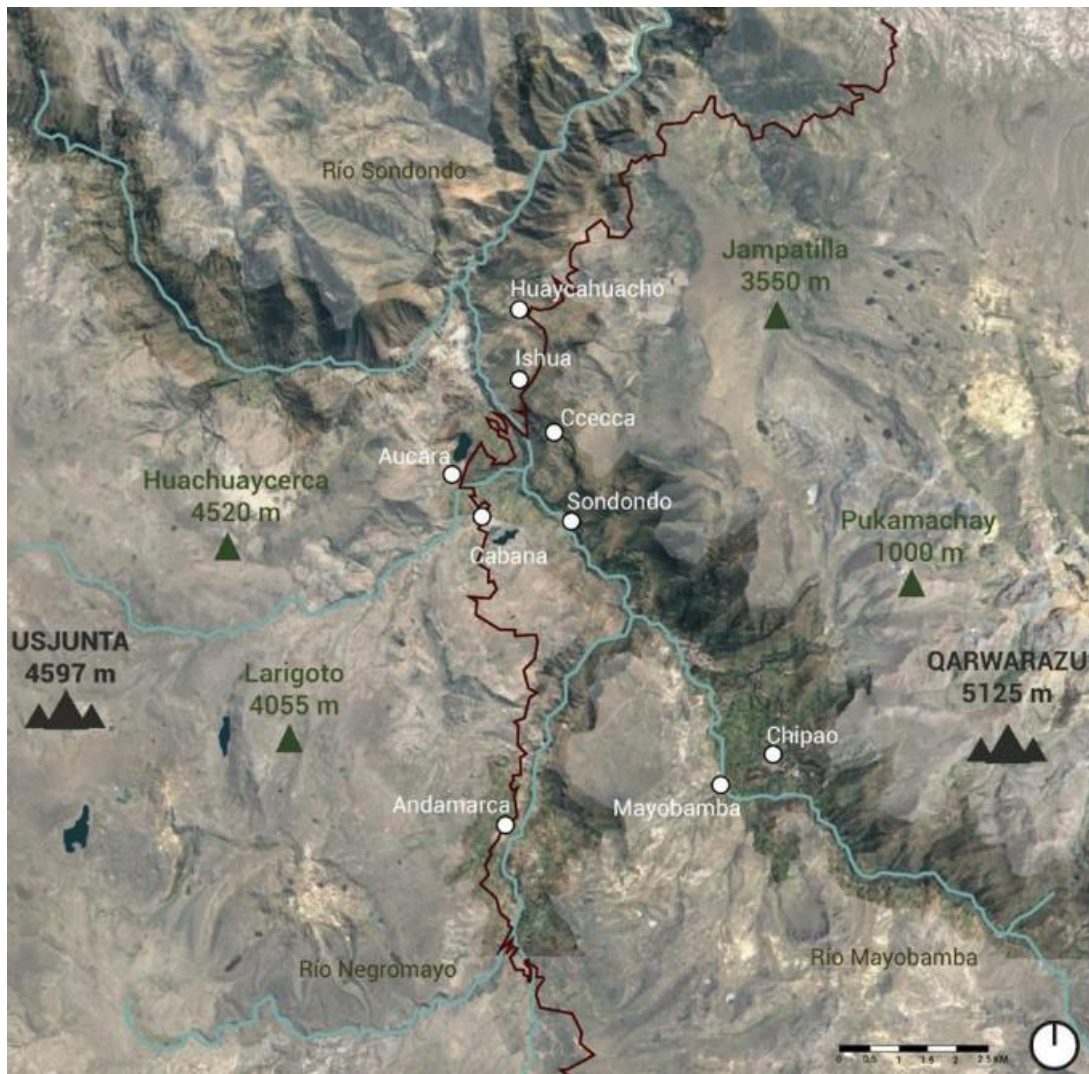
Fig. 1 - Carte de la vallée de Sondondo, avec les principaux centres de population et les montagnes tutélaires (Projet Paysages Culturels dans la vallée de Sondondo. PUCP, 2020).

Le district de Cabana couvre une superficie de 405 km 2 (PRODERN, 2016), avec une population totale de 2 189 habitants, dont 1 891 vivent dans le village de Cabana (INEI, 2017).