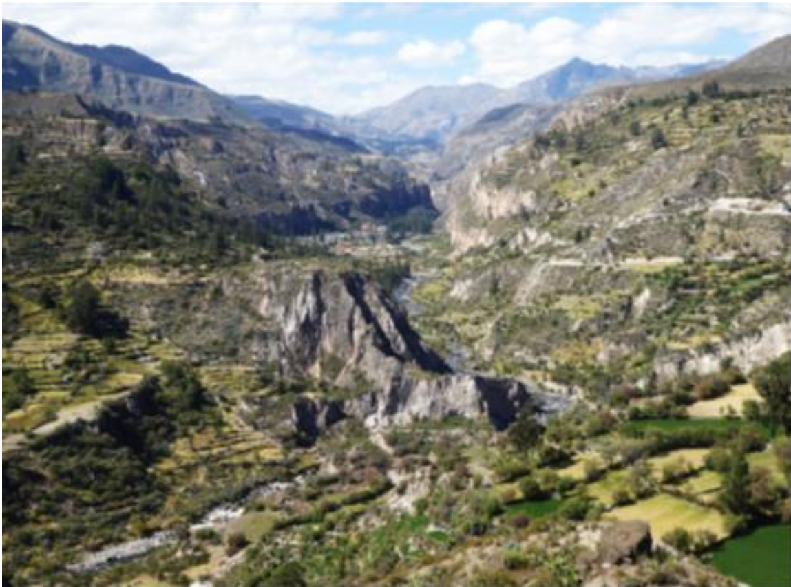
Fig. 2 - Vue générale de la vallée de Sondondo depuis le nord

Tous ces éléments ont créé les conditions idéales du développement d'une multitude de zones écologiques, favorisant la diversité génétique et la culture d'une grande variété de plantes indigènes, auxquelles d'autres ont été ajoutées créées et adaptées, garantissant un régime alimentaire équilibré et une relative sécurité alimentaire.